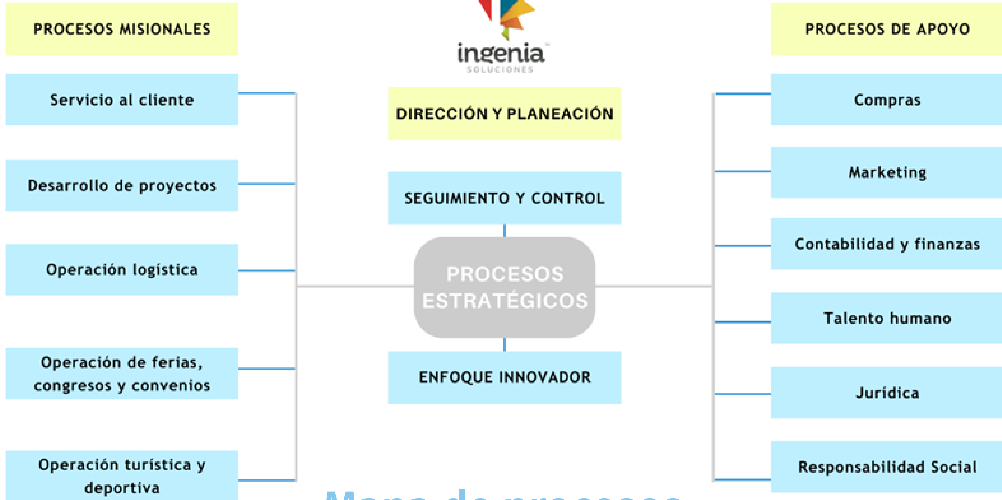
Mapa de procesos